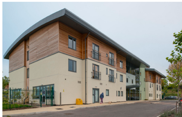
Gofal ychwanegol Plas Telford. Wrecsam (Cymdeithas Dai Clwyd Alyn)

Cymerwyd y rhagamcaniadau poblogaeth a ganlyn oddi wrth Daffodil Cymru 8 ; mae data ynglŷn â chyflenwad fel a ddarparwyd gan EAC 9 ac fel sydd ar gael ar Stats Cymru 10 ; mae wedi'i gydategu gan ragor o wybodaeth a gafwyd oddi wrth arbenigwyr yn y sector.