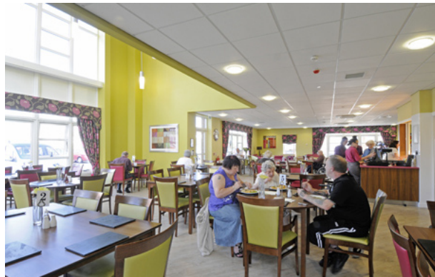
Llys Enfys yn Llanisien, Caerdydd (Linc Cymru)

Er bod yna nifer sylweddol o gynlluniau tai gofal ychwanegol wedi'u datblygu yn y blynyddoedd diwethaf, gydag ond nifer fechan ar y gweill, mae'n parhau i fod yn faes o wasanaeth sy'n gymharol anghyffwrdd o ran ei botensial fel opsiwn tai, gofal a chymorth i bobl hŷn yng Nghymru. Mae hyn yn neilltuol o wir am berchen-feddianwyr, y gall rhai ohonynt fod yn bwriadu gwneud dewis ffordd o fyw drwy "leihau maint", ond mae hefyd yn gweddu i'r rheiny fyddai'n ceisio rhyw fath o opsiwn tai cymdeithasol