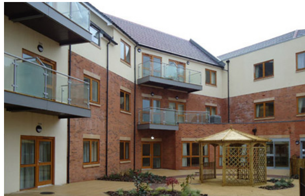
Llys Jasmine, yng nghanol Yr Wyddgrug, Sir y Fflint, yw un o'r safleoedd cyntaf yng Nghymru i gynnwys fflatiau pwrpasol i bobl â dementia o fewn cyfleuster tai gofal ychwanegol (Cymdeithas Tai Wales & West)

Mae yna dystiolaeth sy'n dechrau dod i'r amlwg o bob cwr o'r Deyrnas Unedig sy'n awgrymu y gall tai gofal ychwanegol wneud gwahaniaeth sylweddol i iechyd a lles eu trigolion, yn ogystal â chynnig effeithlonrwydd o ran darparu gofal, a gwneud cyfraniad positif at gymunedau lleol mewn nifer o ffyrdd. Mae'r corff o dystiolaeth yng Nghymru yn tyfu, a bydd y gwerthuso a gynlluniwyd eleni gan Lywodraeth Cymru o gynlluniau y maent wedi cyfrannu grant tai cymdeithasol tuag atynt yn darparu rhagor o wybodaeth am yr hyn a gyflawnir yn genedlaethol.