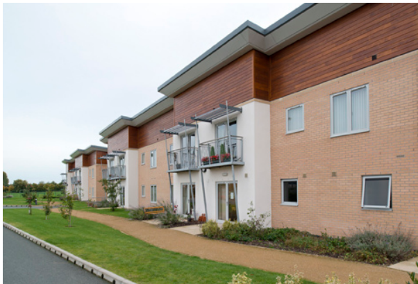
Llys Eleanor, Shotton, Glannau Dyfrdwy (Tai Pennaf)

dylai tai gofal ychwanegol fod â rhan allweddol yn y strategaeth i gyflawni'r weledigaeth hon.