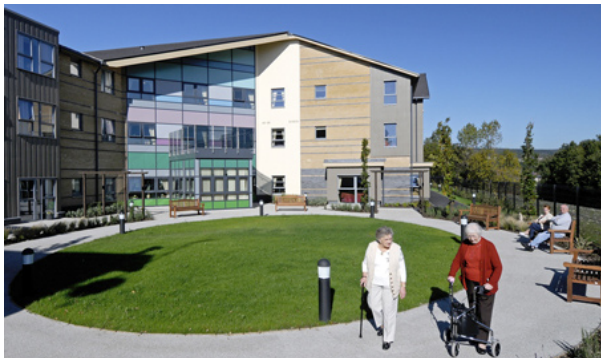
Gofal ychwanegol Llys Glyncoed, Glynebwy (Linc Cymru)

Nid yw bob amser yn hawdd disgrifio beth yw tai gofal ychwanegol, a'r hyn y gall ei gynnig i'r person hŷn unigol, ei deulu, cymunedau lleol, a chomisiynwyr awdurdodau lleol a byrddau iechyd. Mae yna amrywiad eang rhwng gwahanol gynlluniau, gwahanol ddarparwyr a gwahanol dulliau comisiynu. Defnyddir hefyd wahanol enwau i ddisgrifio'r gwasanaeth hwn, yn cynnwys tai gofal ychwanegol, tai gwarchod a gofal, a byw â chymorth (a ddefnyddir yn aml gan y sector preifat); mae modd dadlau nad oes yr un o'r rhain yn disgrifio'r gwasanaethau a gynigir mewn ffordd fyddai'n ystyrlon i berson hŷn neu i'w deulu, ac mae yna ddadl dros greu dull gweithredu tuag at ddarparu a disgrifio tai ar gyfer pobl hŷn sy'n adlewyrchu'r hyn sy'n bwysig i bobl leol a chymunedau lleol.