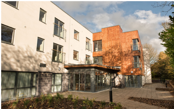
Cae Garnedd, Bangor (Cymdeithas Tai Gogledd Cymru)

Gall darparu opsiwn tai ychwanegol, deniadol o fewn cymuned leol fod o gymorth i roi tai ar gael i deuluoedd, tai ag ystafelloedd nas defnyddir, p’un ai bod y rhain yn dai cymdeithasol neu’n dai i berchen-feddianwyr. Mae hyn yn neilltuol o bwysig lle ar hyn o bryd y ceir ond nifer cyfyngedig a/neu anneniadol o opsiynau, megis tai gwarchod hen-ffasiwn neu amhriodol a chyn lleied i ddenu person hŷn i symud o’u cartref teuluol.